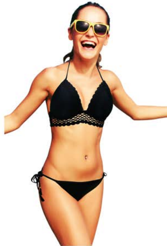
Ref.:365215 - Bikini top 12€ Ref.:365221 - Bikini braguita 9€

Prueba los diferentes estilos y disfruta de un verano sin límites con los bikinis más cómodos y atractivos.